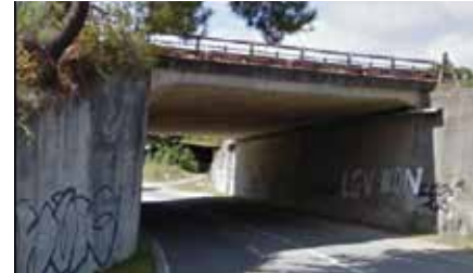
Pont de la route D 126 avant travaux.

Le pont de la route départementale D 126 , situé sur la commune de Labenne, va être élargi de part et d'autre du pont existant.