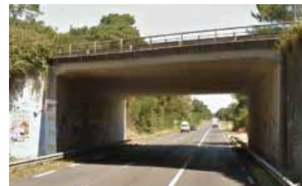
Pont de la route D 810 avant travaux.

Le pont de la route départementale 810 , situé sur la commune de Labenne, va être élargi en venant construire un second pont à côté de celui existant, dans le sens Bordeaux/Bayonne.