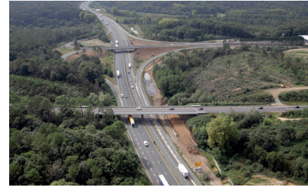
Échangeur n°7 (Ondres) avant travaux.

Une fermeture de l'échangeur n°7 est programmée du 19 au 22 octobre pour permettre différentes étapes de travaux : la pose de balisage, les travaux de chaussées (préparation de la structure, enlèvement des couches supérieures du revêtement, pose du nouveau revêtement) ainsi que la structuration du terre-plein central.