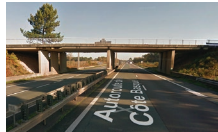
Pont de la route D 28 avant travaux

Le pont de la route départementale 28, qui passe au-dessus de l'autoroute, va être rétabli à côté de l'ouvrage existant.