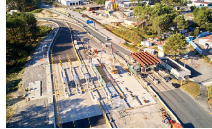
Échangeur n°8 (Capbreton)

La fermeture d'une bretelle de sortie de l'échangeur n°8 est programmée la nuit du 29 novembre 2018 pour permettre la mise en œuvre d'un ouvrage de traversée (buse) permettant d'assurer la continuité de l'assainissement de la plateforme autoroutière. Cet ouvrage est installé en tranchée, transversalement sous la chaussée de la bretelle.