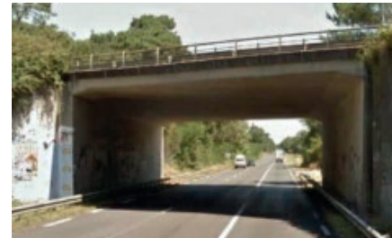
Pont de la route D 810 avant travaux.

Le pont de la route départementale 810 , situé sur la commune de Labenne, va être élargi en venant construire un second pont à côté de celui existant, dans le sens Bordeaux/Bayonne.